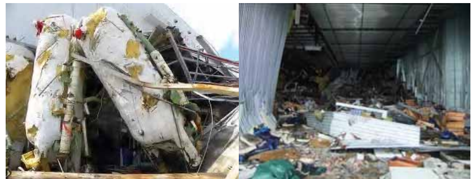
宮城県内食品工場冷凍機