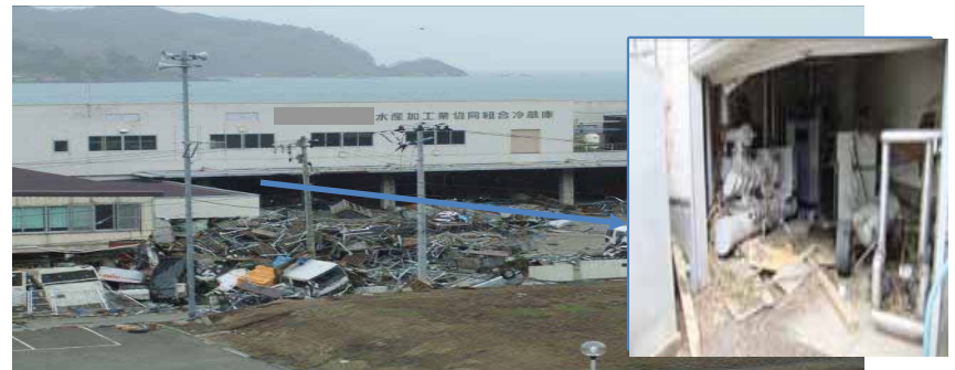
岩手県内水産加工工場