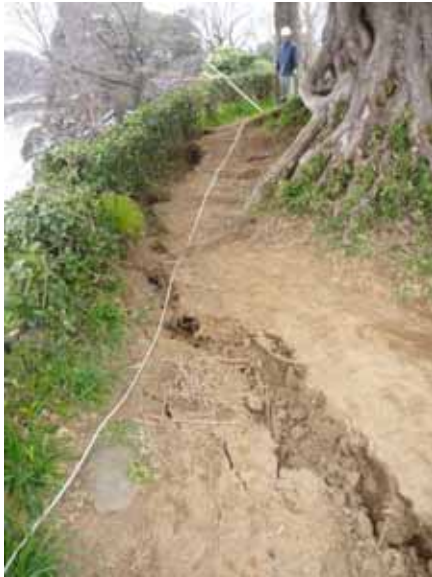
代官町通遊歩道亀裂