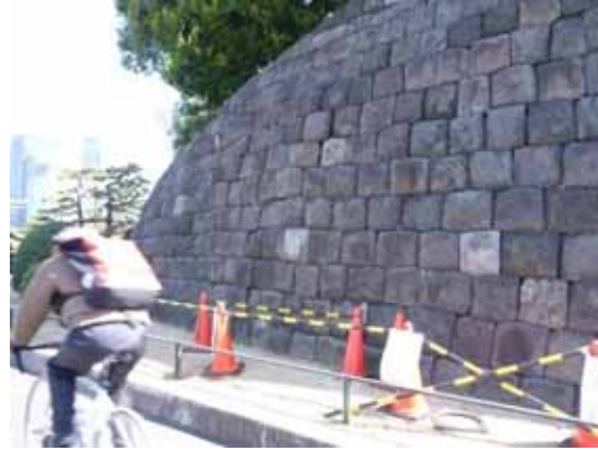
祝田橋付近石垣孕み