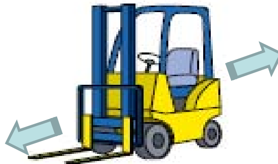
ディーゼルハイブリッド フォークリフト