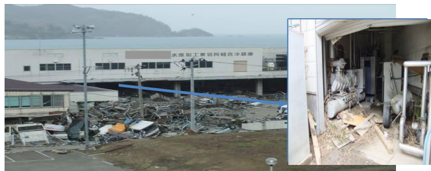
岩手県内水産加工工場