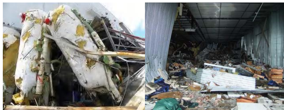
宮城県内食品工場冷凍機