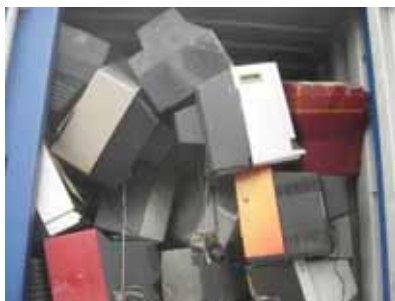
(中古利用目的と称したテレビ)