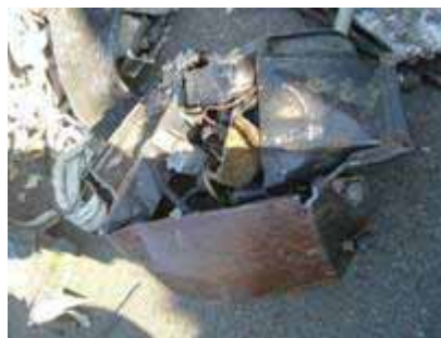
(中古利用目的と称したエアコン室外機)