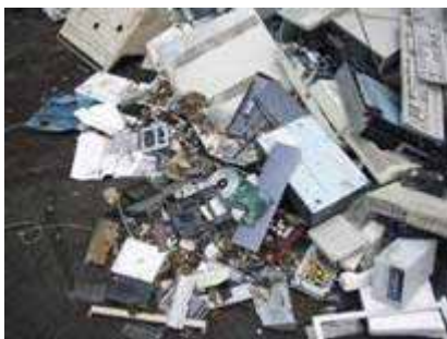
(他の貨物に混入して輸出を図った基板)