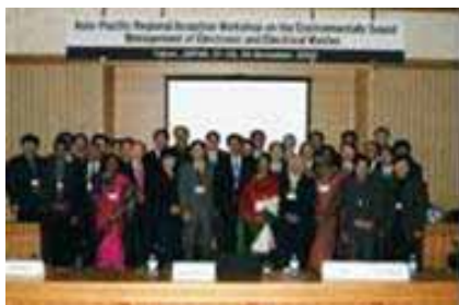
ワークショップの開催

適正な国際資源循環の推進に向け、バーゼル条約当局のネットワークを通じたアジア地域における条約施行能力の向上