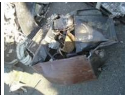
(中古利用目的と称したテレビ) (他の貨物に混入して輸出を図った基板) (中古利用目的と称したエアコン室外機)