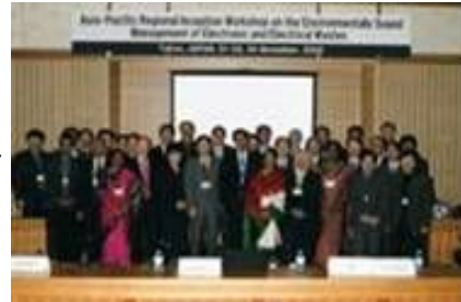
ワークショップの開催

適正な資源循環の管理に向け、担当官同士のネットワークや二国間での管理体制の構築を通じ、アジア各国のバーゼル条約施行能力の向上を図る