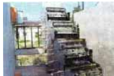
階段式水路処理法