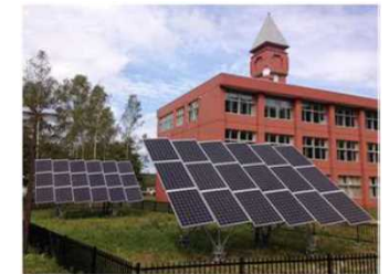
地域の防災・減災と低炭素化を同時実現

避難施設に再エネ設備等を導入し、平時は公共施設の運営に伴うCO 2 を削減。災害時は自立・分散型エネルギーとして活用し、災害時でも避難施設等で照明・空調等を利用可能に。