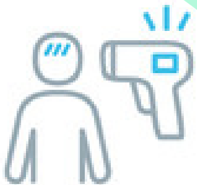
受付時の検温 (37.5℃以上は参加不可)