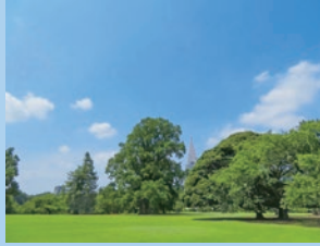
영국 풍경식 정원

공원내에는 풍경식 정원, 정형정원, 일본정원, 이 세가지 정원이 서로 조화되게 디자인되어 메이지시대를 대표하는 근대식 서양정원입니다.