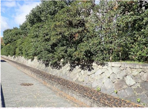
大内保存事業で整備された石垣