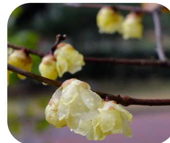
ソシンロウバイ(宗像神社北)