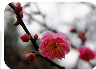
紅梅(出水の小川北)