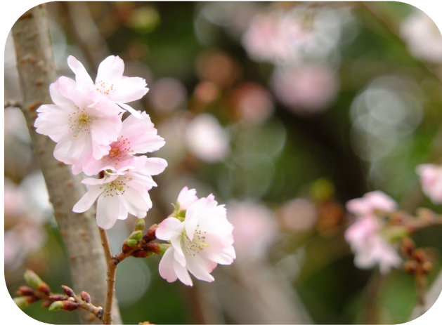
ジュウガツザクラ(出水の小川東)