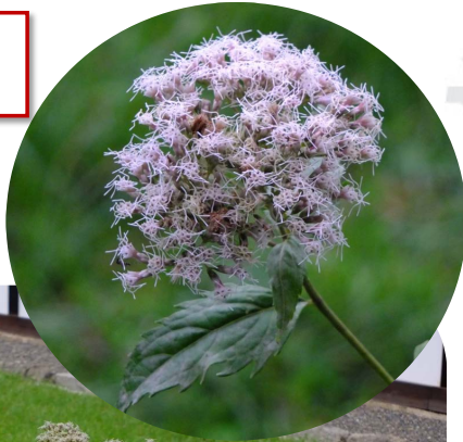
フジバカマ (閑院宮邸跡中庭)