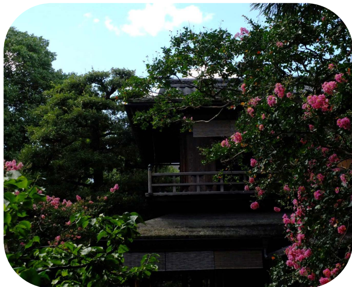
サルスベリ (拾翠亭)