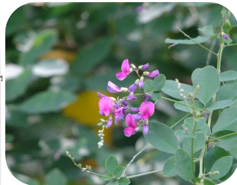
ハギ(富小路口北東)