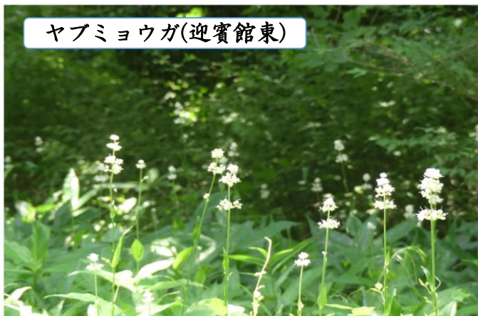
ヤブミョウガ(迎賓館東)