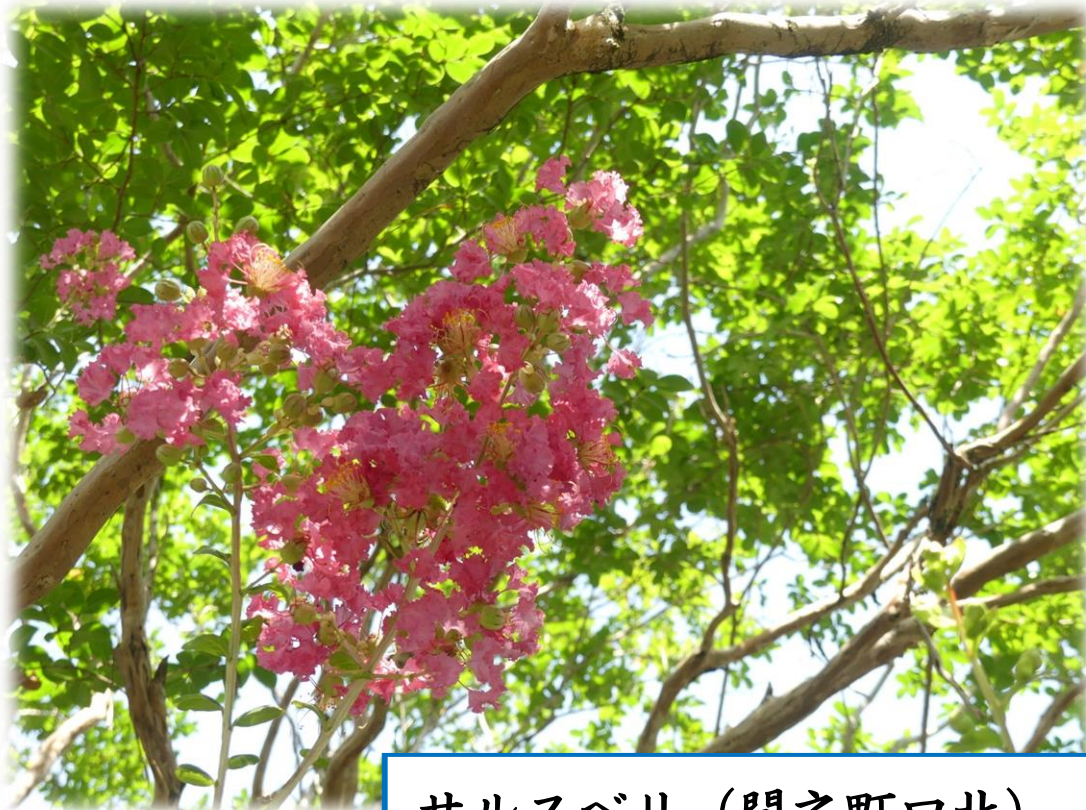
サルスベリ (間之町口北) Crape myrtle