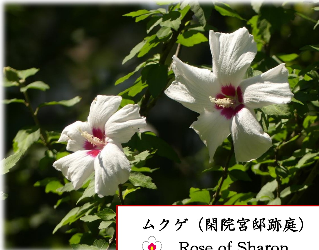
ムクゲ (閑院宮邸跡庭) Rose of Sharon