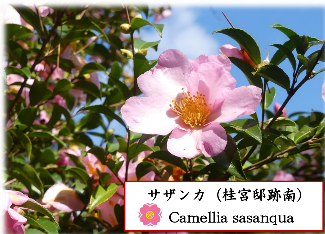
サザンカ (桂宮邸跡南) Camellia sasanqua

現在、苑内各所で赤・白・ピンク、様々な色のサザンカが咲いています。また、苑内各所で八重咲など花卉の枚数も違います。ぜひ花の形態も観察してみてください。