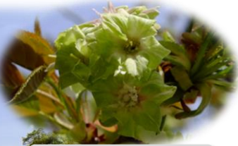
御衣黄(出水の小川)