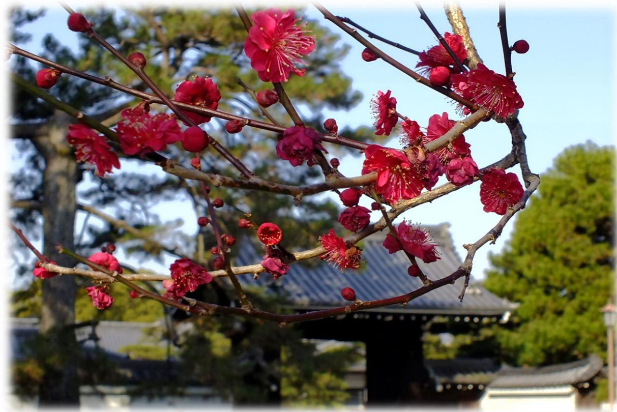
間ノ町口周辺の紅梅