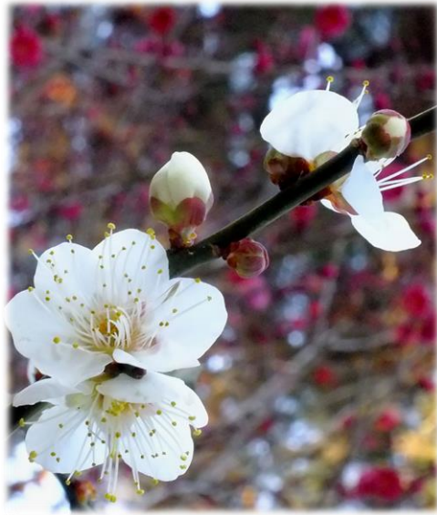
宗像神社北の白梅