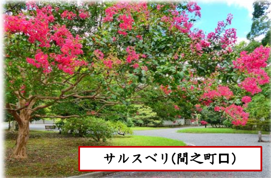
サルスベリ(間之町口)