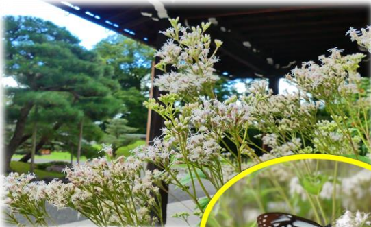
フジバカマ (閑院宮邸跡車寄)

秋の七草の一つに数えられるフジバカマ。 渡りをするチョウ「アサギマダラ」が吸蜜に訪れる かもしれません。