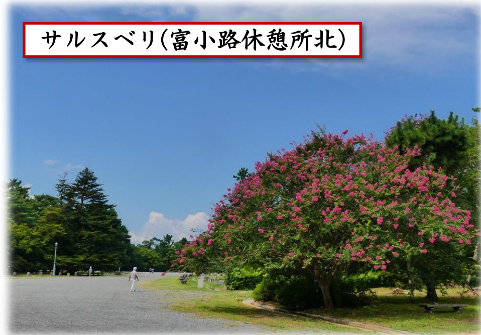
サルスベリ(富小路休憩所北)

苑内各所、ゆっくりとしたペースで開花中です。 富小路休憩所北では見ごろになりました。 10月頃まで花を咲かせます。