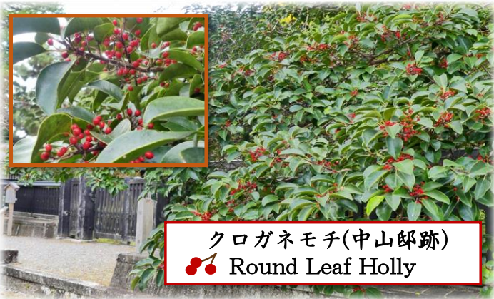
クロガネモチ(中山邸跡) Round Leaf Holly

明治天皇の生家である中山家。ここにはご誕生の際に建てられた産屋と、ご幼名「祐宮」の名前にちなんだ「祐井(さちのい)」という井戸が今も残っております。 現在、中山邸跡のクロガネモチの実が見頃です。