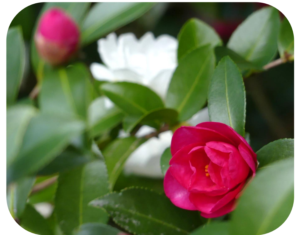
サザンカ(西園寺邸跡)