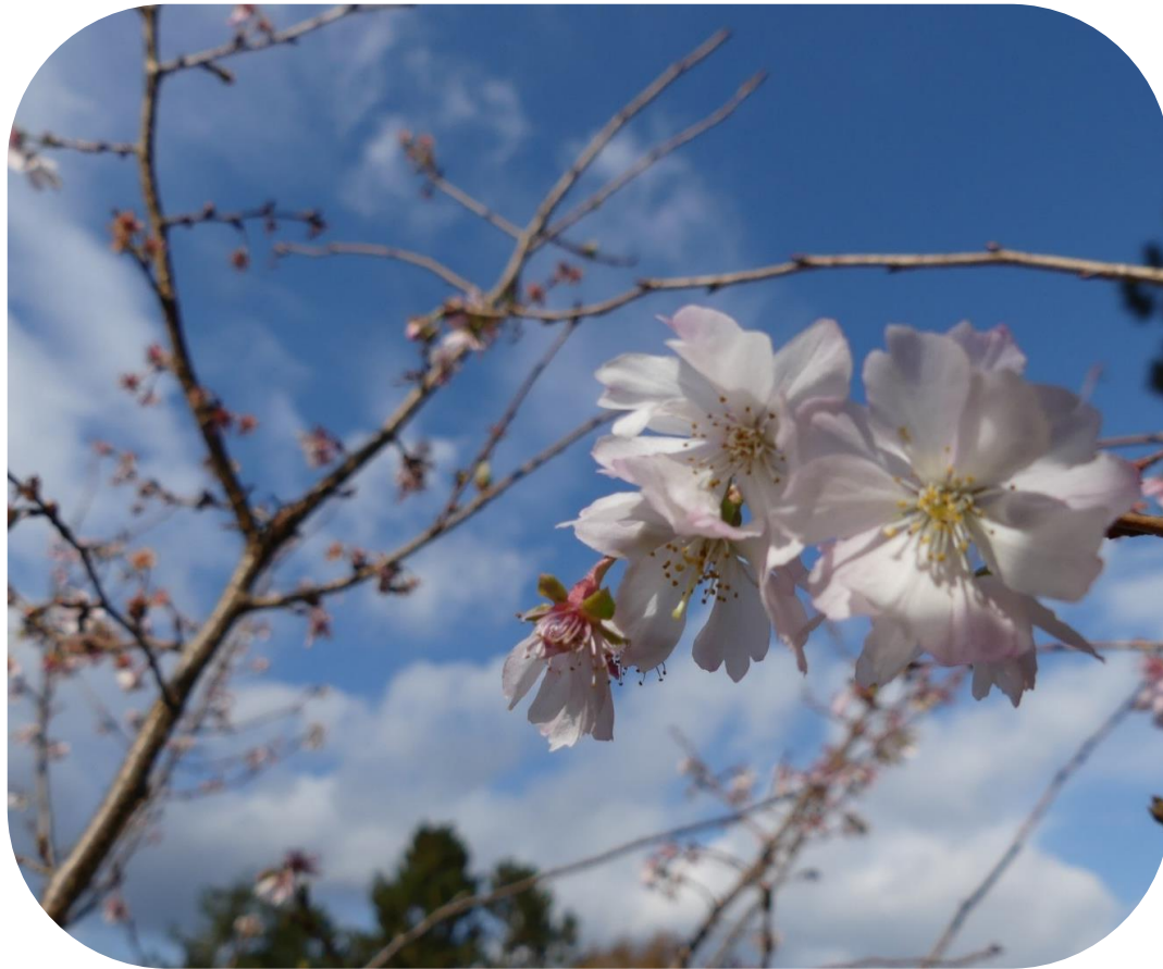
ジュウガツザクラ(出水の小川東)