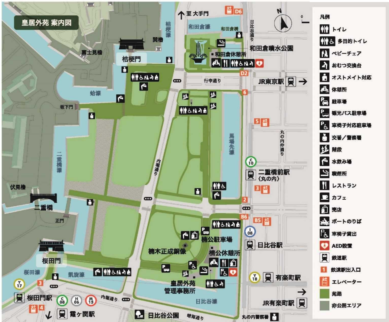
図2 皇居外苑地区の詳細図