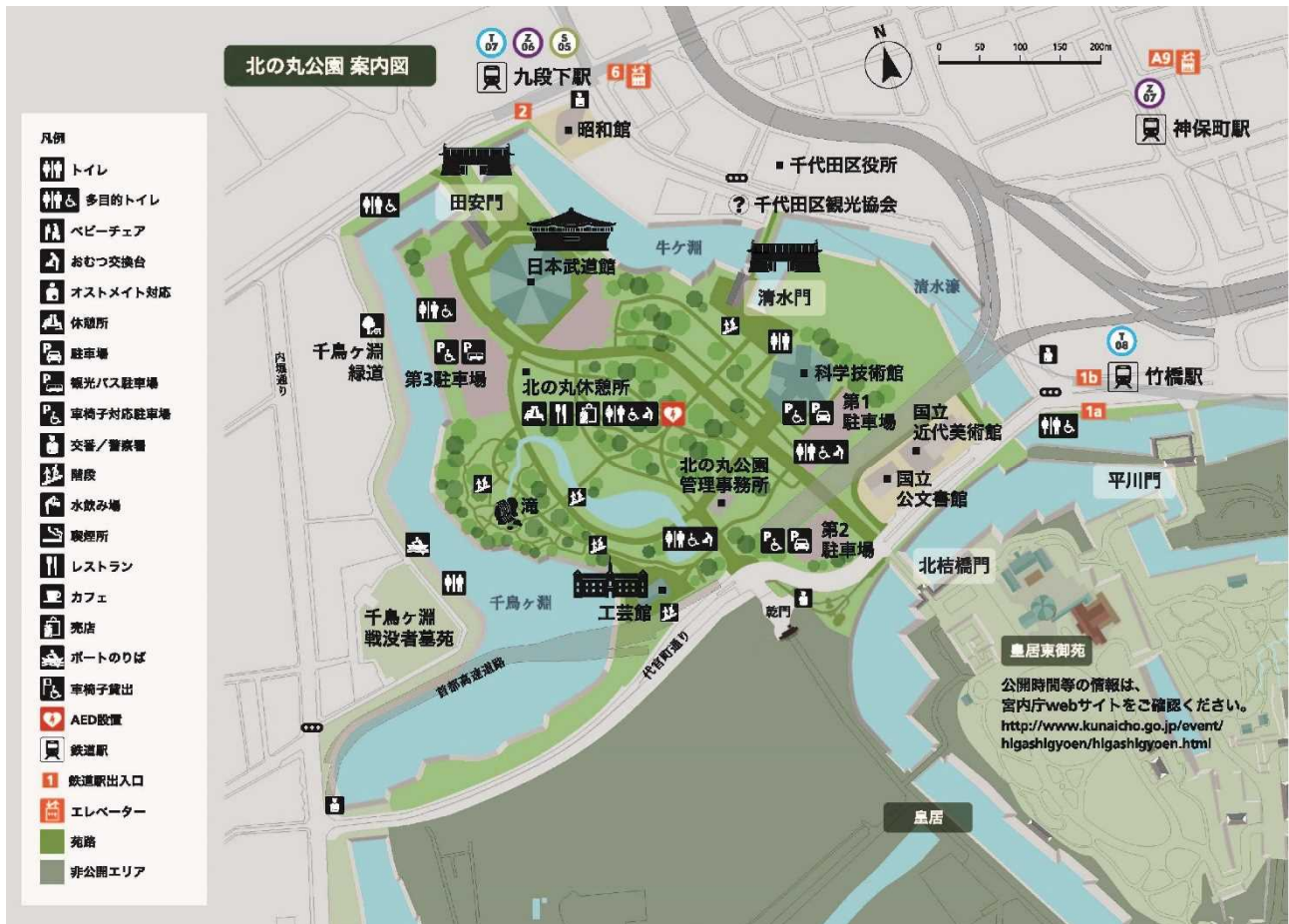
図3 北の丸地区の詳細図