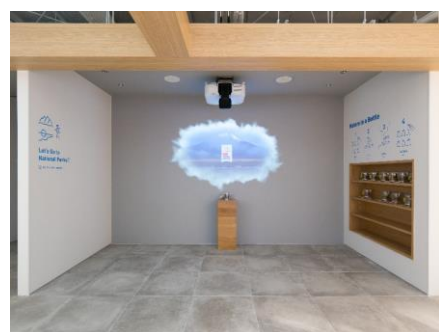
体験型コンテンツ