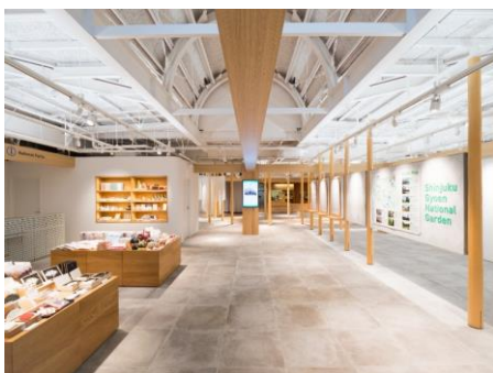
インフォメーションセンター 正面入口