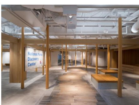
園内側入口 (National Parks Discovery Center)