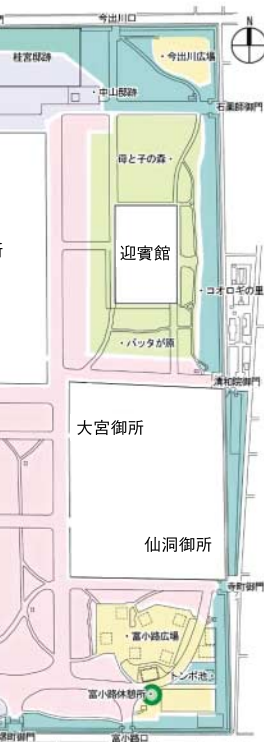
基本計画ゾーニング図

この春までに、それらの場所に駒札型の歴史解説板二十基を立てました。日本語のほか、中国語、韓国語、英語で表示しています。このうち十八基には、解説板の手に小さな凹凸がついた台がついています。そこにA四の大きさの紙をあてて上から鉛筆などでできると絵の一部がでてきます(紙と鉛筆はご自宅でご用意ください)。