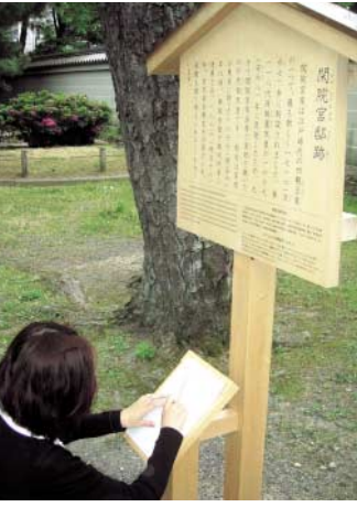
絵が浮かび出す駒札の前の板

(備考) 京都御苑再整備基本計画書、歴史ふれあいの道案内いずれも、京都御苑ホームページから入手できます。アドレスは、 www.enjy.go.jp/garden/kyotogyoen/ です。