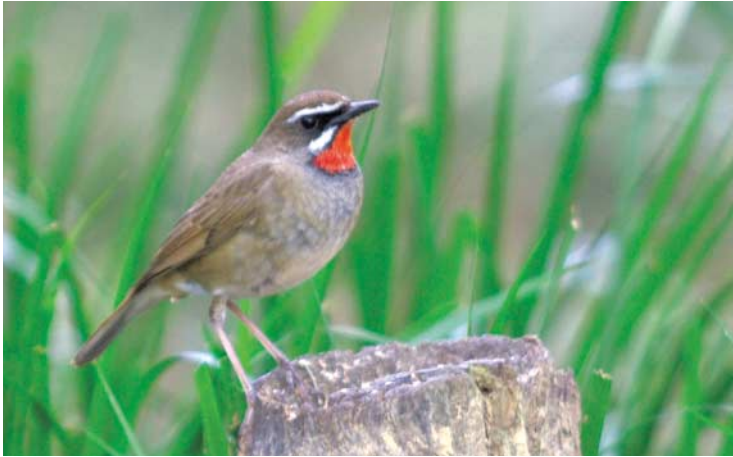
①赤い喉の下に黒い縁取りがあるノゴマ

ノゴマは、主に北海道で繁殖し、東南アジア周辺で越冬する夏鳥です。御苑には、春と秋の二回、渡りの途中に立ち寄っていきま