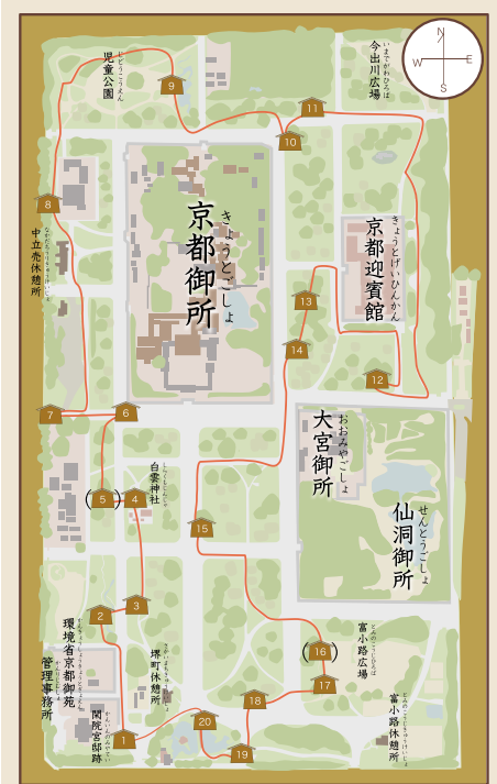
歴史ふれあいの道の順路

自然保護憲章 自然をとうとび、自然を愛し、自然に親しもう。自然に学び、自然の調和をそこなわぬようにしよう。美しい自然、大切な自然を水く子孫に伝えよう。