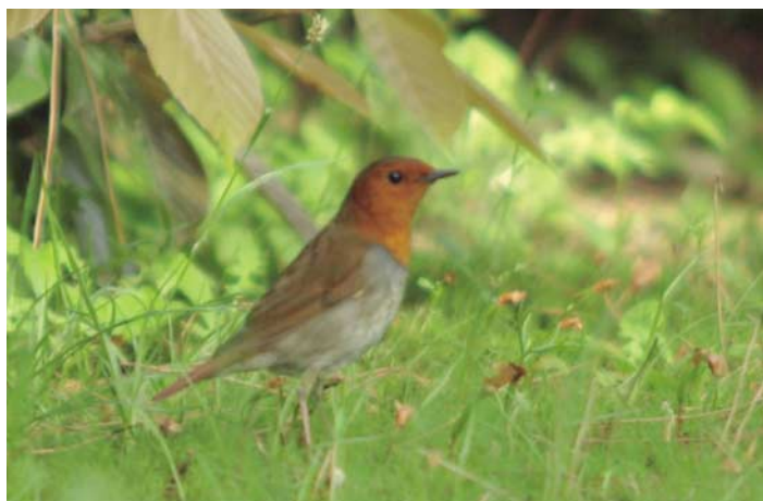
②さえずりの美しさで名高いコマドリ

「数寄屋生活空間、建物と庭をまとめて一つの生活環境としてとらえたい」ということ。家(外)と庭との融合。2自然素材の多用。