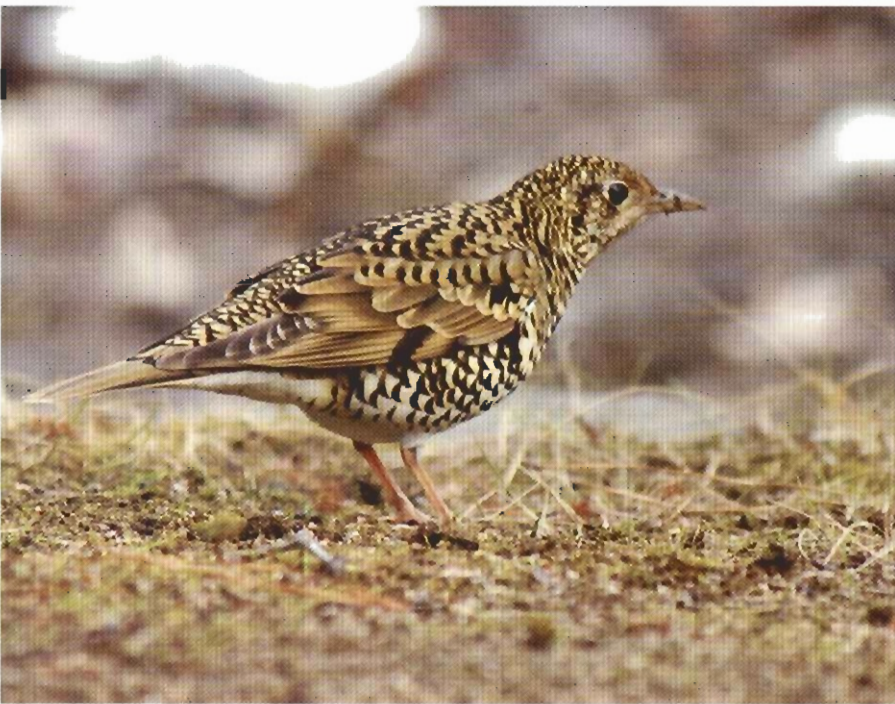
数歩歩いては姿勢を正すユーモラスなトラツグミ

平家物語の「又エ伝説」では、近衛天皇の仁平年間、妖怪又エが夜な夜な御所紫宸殿の上空に出没し、天皇や女官たちを不眠に落とすといったと記されています。天皇は、源三位頼政に命じて又エ退治をさせました。午前二時ごろ黒雲とともにやってくる妖怪に矢を射るとみごとに当たって落ちてきて、確かめると、頭はサル、体はタヌキ、尾はヘビ、手足はトラという怪物で鳴き声はトラツグミであったとされています。「尾はヘビ」のように長めだとか「手足はトラ」という体のトラ真のイメージなどトラツグミに結びつくところもあります。「ヒョー・ヒョー」という哀えを帯びた声を夜中に聞いたら薄気味悪く、地方によっては、地獄鳥とか幽霊鳥とも呼ばれてい