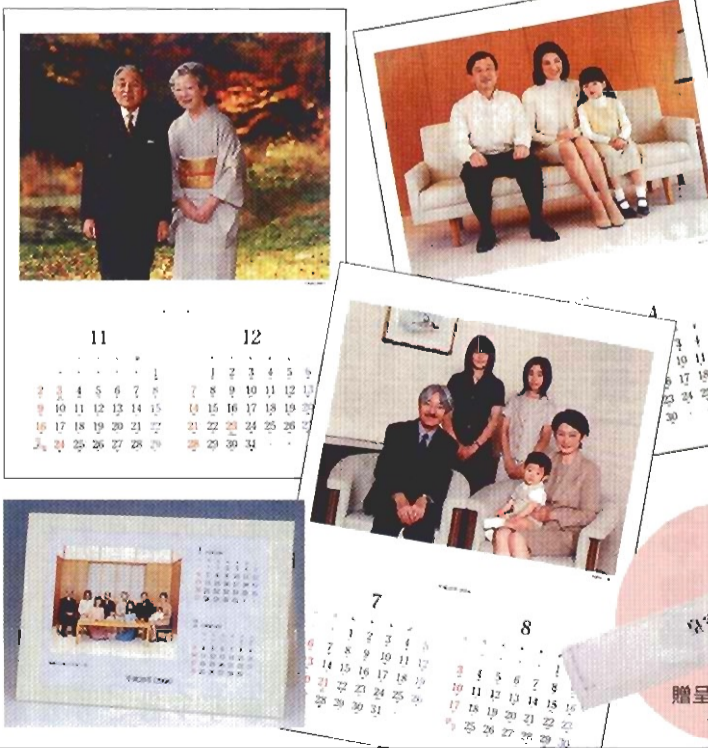
贈呈用1本入れ化粧箱