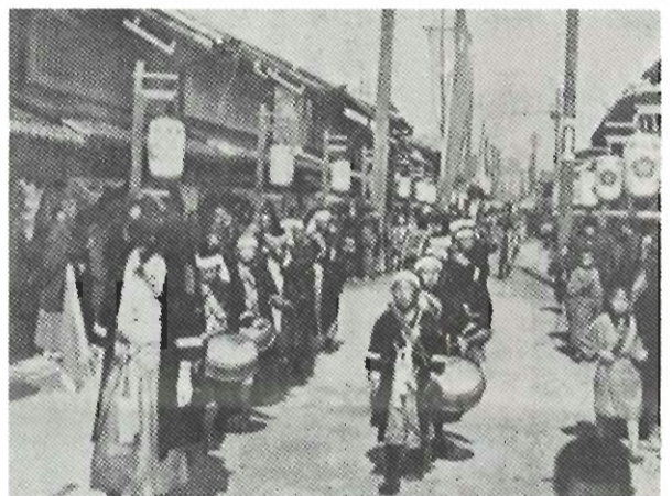
初回の時代祭 山国隊

近代化教育を促進、地場産業振興策としての京都博覧会の開催、インフラ整備としての琵琶湖疎水の掘削、発電所の建設、路面電車の敷設など近代都市基盤の確立のための一連の事業が進められた。その当時の様子は明治十二年の都をどりのテーマ