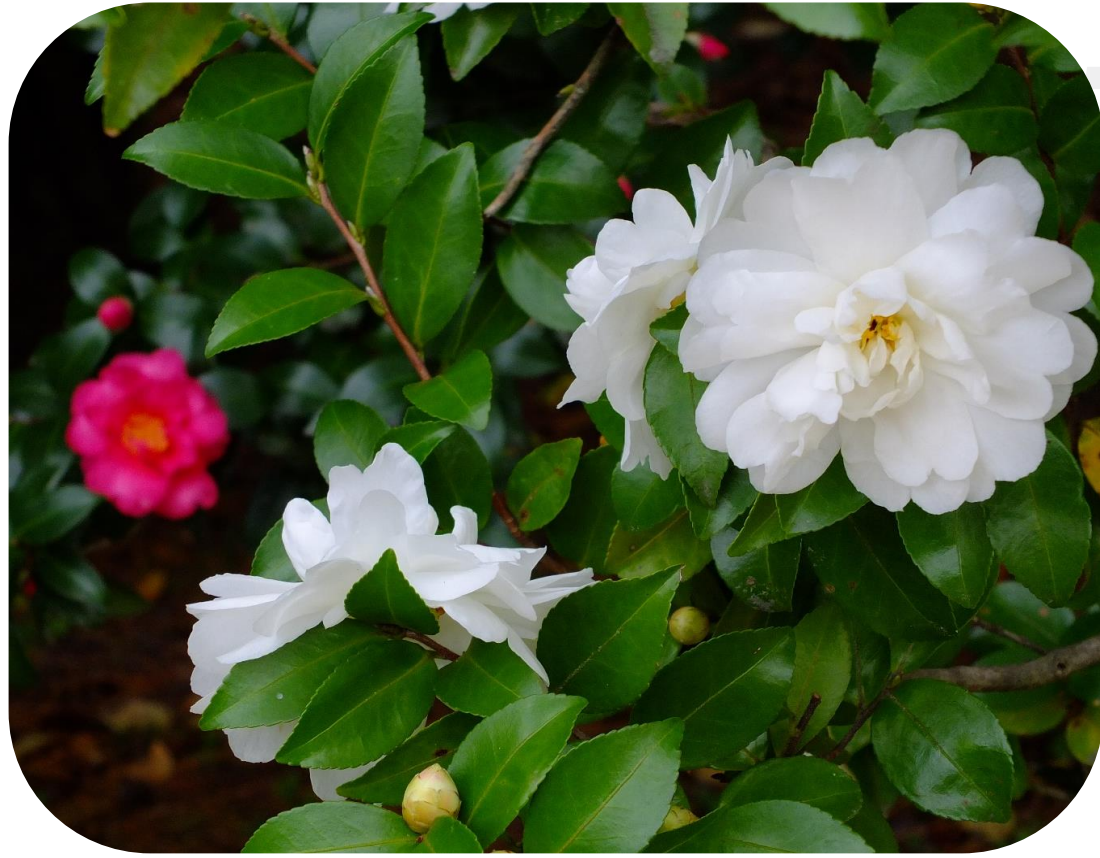
サザンカ(西園寺邸跡)