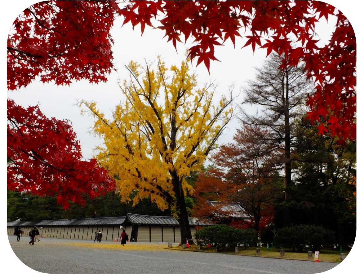
モミジとイチョウ(一条邸跡)