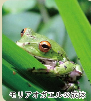
モリアオガエルの成体