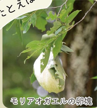
モリアオガエルの卵塊