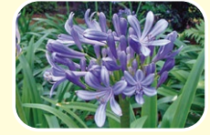
5 百子莲 7月 8月 9月