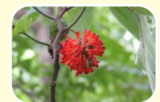
10 构树(果实) 7月 8月 9月