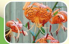
7 卷丹 7月 8月 9月