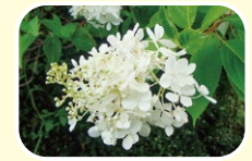
8 八仙圆锥绣球 7月 8月 9月