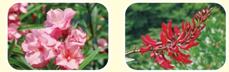
1 夹竹桃 7月 8月 9月