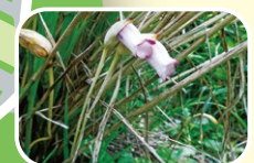
9 野苺 7月 8月 9月