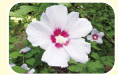
4 木槿 7月 8月 9月