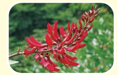
2 珊瑚刺桐 7月 8月 9月