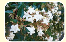
3 大花六道木 7月 8月 9月