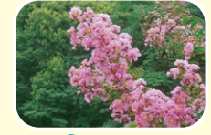
6 紫薇 7月 8月 9月