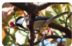
衔着山茱萸果实的 远东山雀

秋天是许多植物结果的季节。新宿御苑也将迎来山茱萸、日本紫珠、日本石柯等各种果实的成熟。这些果实也是生活在城市中的生物们的重要食物和住所，支撑着它们的生命。