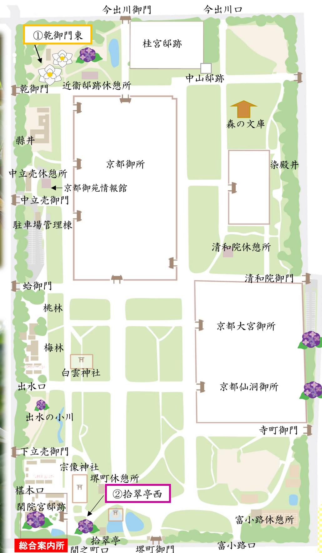
タイサンボク Southern magnolia アジサイ Hydrangea

一見花びらに見える部分は「装飾花」と呼ばれるガクで、本当の花は、中心部にある小さなつぼみのような部分です。