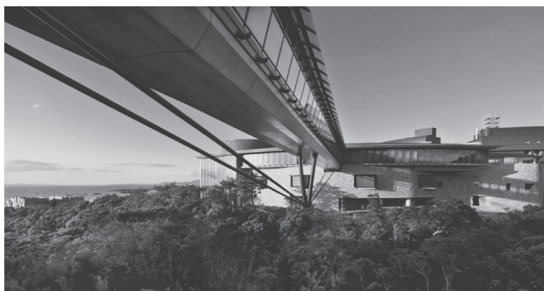
Sky Walk and the Center Building / Okinawa Institute of Science and Technology (OIST) Graduate University

OIST buildings and research facilities have been constructed with great consideration to environmental responsibility and optimal use of energy. In 2013, OIST's Laboratory 2 earned a green building certification in new construction under the internationally recognized standard, Leadership in Energy & Environmental Design (LEED), for its innovative design and construction.