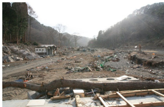
Nakanohama after the tsunami attack 津波被害を受けた中の浜