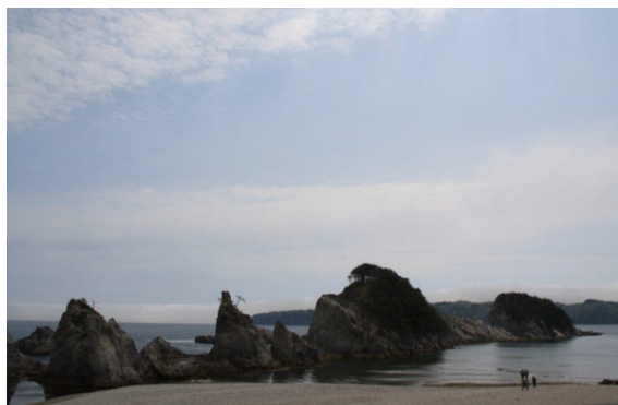
Impressive white rocks on Jodogahama 白い岩が印象的な浄土ヶ浜

The itinerary might be changed due to bad weather. コースについては、天候等により変更する場合があります。 Bring raingear when forecast is not good. 雨などが想定される場合、雨具を持参してください