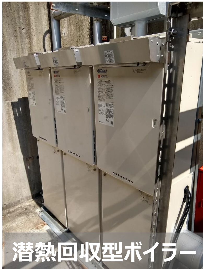
潜熱回収型ボイラー