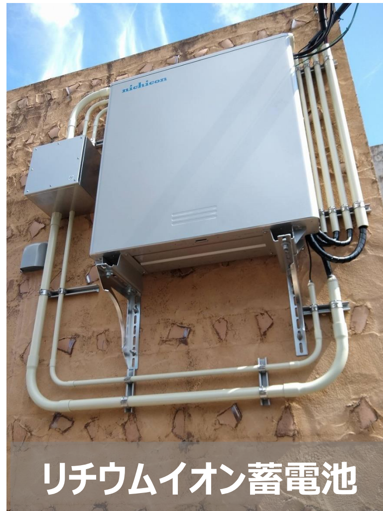
リチウムイオン蓄電池