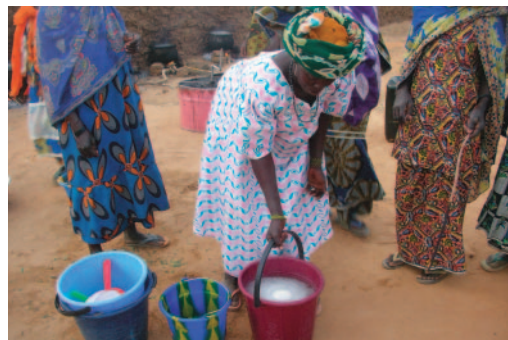
石鹸づくりの研修

【所感】 各地区の代表者は、全体会合への出席やその結果の地区ごとの会合での説明などの責任を負っているが、会合や視察旅行のような場には、公平に「きちんと経緯を説明できる人」という条件に基づいて人選が行われていた。また、女性の間でも適任者の推薦が行われるなど合理的な意思決定がなされていたと感じられた。