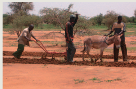
蓄耕研修。

本事業では、ワークショップや計画作成の段階で、お金をかけずに地域にある資源を活用した技術の移転・普及を行うことを村人に伝えることにより、トライアルグループ自身で機材の調達を行うなど、自立的な取組が生まれた。