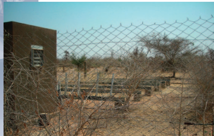
持ち去られた太陽光パネル

我が国は、1995年-2002年にブルキナファソ国において、乾燥地域における地下水の有効利用のため地下ダムの建設を行い、年間約2,700m 3 の水が住民に供給されるようになった。しかし、現在、このダムは地下水を汲み上げるポンプのエネルギー源となる太陽光パネルが破損し、十分に機能していない。