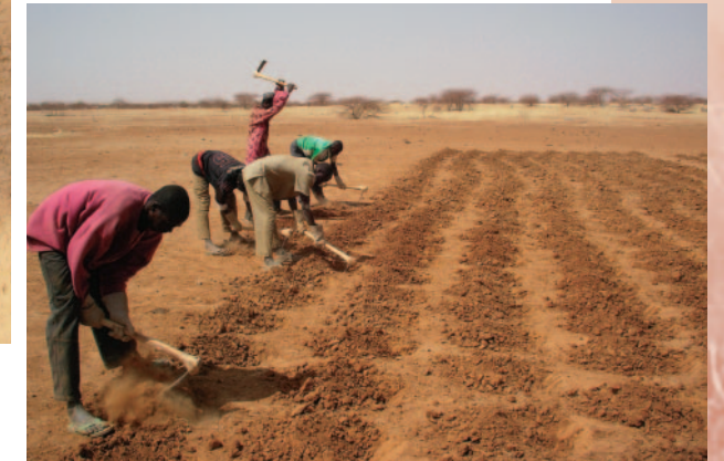
ザイの穴を掘るトライアルグループメンバー