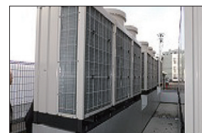
損傷・異音・異常振動の有無の確認