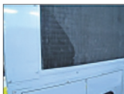
室外機の油にじみ