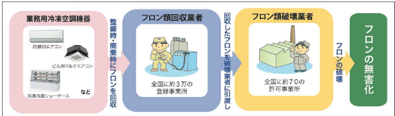
図 1 フロン回収・破壊法の概要

しかし、冷凍空調機器用の冷媒として使用されるHFCが急増しており、さらに、経済産業省の調査(経済産業省が把握するフロン使用製品約 26 万サンプルが対象)により、業務用冷凍空調機器の廃棄時の漏えいと同程度の機器使用中の漏えいが判明した。