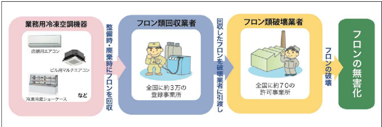
図1 フロン回収・破壊法の概要

しかし、冷凍空調機器用の冷媒として使用されるHFCが急増しており、さらに、平成20年の経済産業省の調査(経済産業省が把握するフロン使用製品約26万サンプルが対象)において、業務用冷凍空調機器の廃棄時の漏えいと同程度の機器使用中の漏えいが判明した。