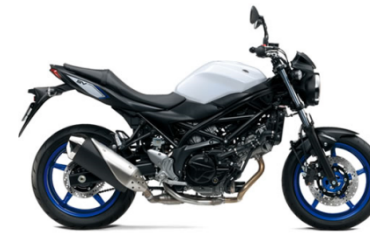
二輪車： SV650 ABS