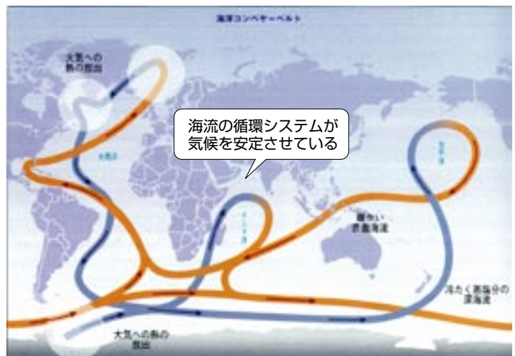
■ 世界の海洋の地球規模循環システム (文献15より)

世界の海では、暖かい海流と冷たい海流からなる循環システムが成り立っており、これが地球の気候を安定させるのに役立っています。21世紀中に温暖化が急速に進むと、この重要な大きな循環システムをも、急激に、しかも大きく変えてしまう可能性があります。そうすると、世界の気候がどのように変化し、どんな現象が引き起こされるか、とても予測することはできません。