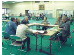
参加者どうして省エネの取組について情報交換を行う様子