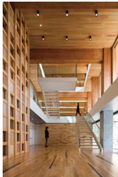
大阪木材仲買会館 (木造オフィス)