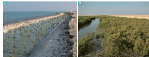
人工水路に植えられたマングローブ (A、B)