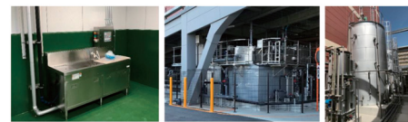
生ごみ粉砕機 原料槽 バイオガスタンク 【バイオガスシステムイメージ・外観】