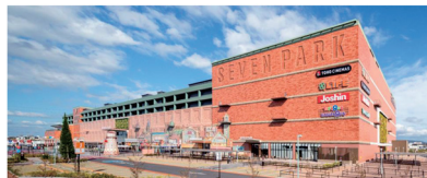
【設備システム採用建物 外観】

セブンパーク天美は、延床面積約12万m 2 の大型複合商業施設である。建設計画を行う際、地域に与える影響を最小限に抑える設備計画を行う事を目的として、主要コンセプトを「地球環境保全」「働きやすさの向上」に設定した。従来型の普及省エネ技術の採用と共に、天候等から将来予測する先進的技術を搭載した次世代BEMS、同規模商業施設で国内初のバイオガスシステムにチャレンジした。敷地内の省エネルギーや省CO 2 だけでなく、敷地外に影響のある廃棄物(生ごみ、汚泥)の負荷を低減している。建物運用開始後も定期的に運用報告会を開催している。また、BCP強化による安全性向上や、壁面、大規模駐車場緑化、地域の木材活用等、幅広く環境を意識した計画とした。