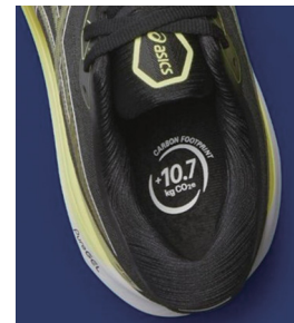
「GEL-KAYANO 30」温室効果ガス排出量の算出と表示を実施