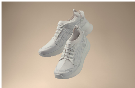
温室効果ガス排出量世界最少スニーカー 「GEL-LYTE III CM1.95」

※2023年9月時点、製品ライフサイクルにおける温室効果ガス排出量が開示されている市販シューズを対象としたデータに基づく。