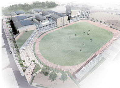
立命館中学校・高等学校 長岡京キャンパス全景

立命館中学校・高等学校の長岡京キャンパスは環境配慮技術の5つの柱(地域性を活かした計画、自然エネルギー利用、ピークカットに寄与する電力デマンド低減、災害時の地域貢献と省エネの両立、学校活動と連携した環境の取り組み)を軸に、建築・設備技術が融合した新しいエコスクールとして2014年9月に開設した。キャンパス各所に太陽光や雨水の積極利用、CO 2 削減の工夫をはじめ、環境に関するパネル展示等も行い、校舎自体を環境教育の学びの場と位置づけ探究学習にも活用している。あわせて創エネ・蓄エネによる継続的な電力確保や水貯留槽設置により地域住民の避難所としての機能も有していることも特徴。毎年11月にはJSSF(Japan Super Science Fair)やRSGF(Rits Super Global Forum)を主催し、海外約20カ国・地域の生徒とSDGsなどのテーマについて学び、交流を深めている。