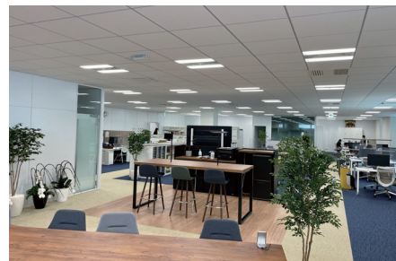
ABWを採用した社員交流を促すフレキシブルなオープンスペースエリア