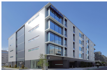
2022年4月にリニューアルした明電興産(株)本社新社屋 外観

明電興産の本社社屋の老朽化に伴い、ABW(アクティブベースドワーキング)を取り入れた新社屋に建て替えた。新社屋では、自然採光を取り入れる開口窓の最適配置、照明のLED化等を実施し、大幅な省エネを実現した。また、明電舎開発機のマルチPCS(パワーコンディショナシステム)を導入し、太陽光パネルで発電した電気を蓄電池やEVへの充放電、新社屋の自家消費電源として利用している。これらにより、建築物省エネルギー性能表示制度「BELS」の最高ランクの認証と、経済産業省が定義するZEBの評価の一つ「ZEB Ready」の認証を取得。更に、当社グループの風力発電事業会社であるエムウインズの風力発電所で発電した Made in MEIDENのCO 2 フリー電力を使用することで、Scope1,2をゼロとし年間約49tのCO 2 を削減した。